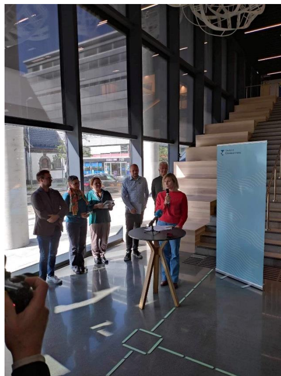
Figur 1: Pressekonferanse i Vestlandshuset etter at vi hadde komme til einigheit med Ap, Sp, KrF, V og Mdg å fortsette å styre Vestland i fire nye år.