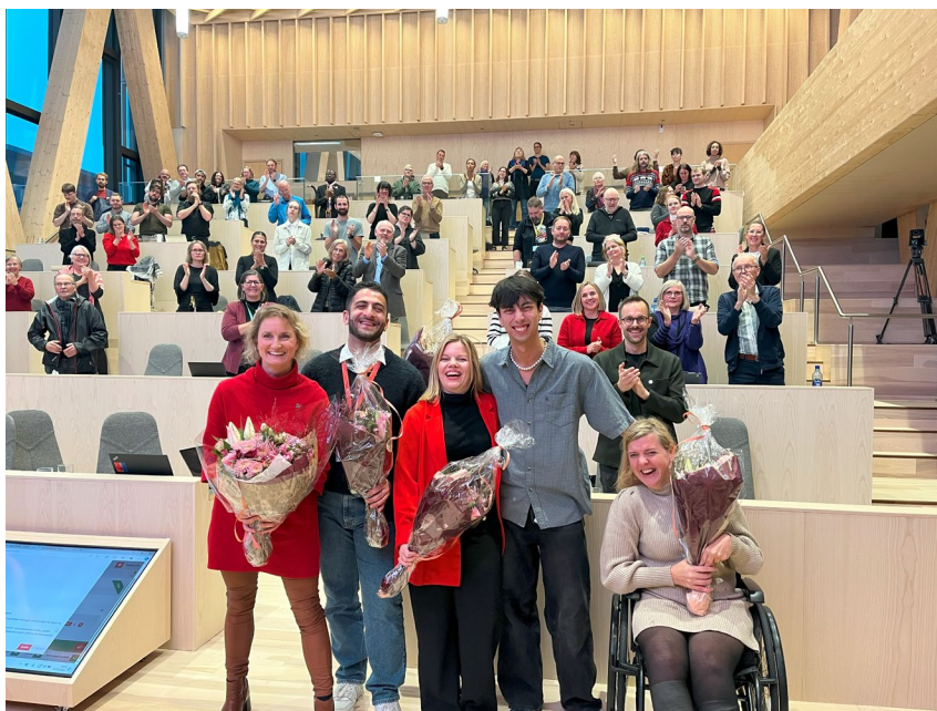
Figur 12 Topp 5 under nominasjonsmøtet