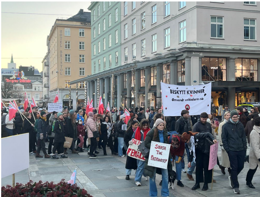
Figur 8 8. mars-toget i Bergen