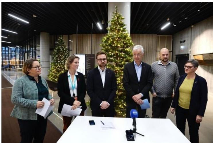
Bilete 2: Samarbeidspartia sin pressekonferanse om fylkesbudsjettet for 2025 i november 2024.

Den styrande koalisjonen som SV er ein del av held framleis saman. Dette er Ap, Sp, MDG, V, KrF og SV. Samarbeidsplattforma som ein styrer på kan lesast her 1 . SV sin representasjon i folkevalde organ, og i styrer, råd og utval er vist i Tabell 1 og Tabell 2 .