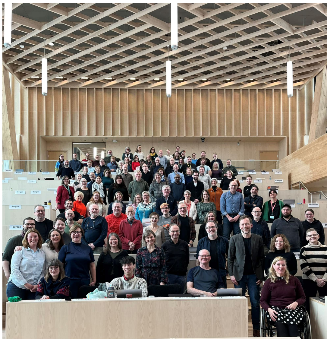
Figur 1 Alle deltakarane på Fylkesårsmøtet 2024

Årsmeldinga er gjennomarbeidd av fylkesstyret med tilsette, men ikkje grundig korrekturlest.