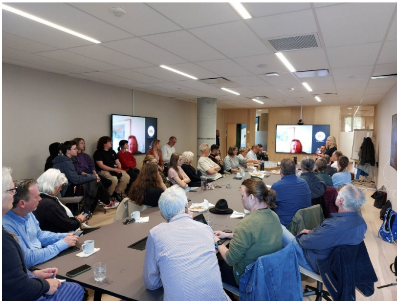
Figur 10: fullt hus på møte med Kristi Bergstø i regi av Miljøpolitisk utval i Vestland

Nokon av spørsmåla partileiaren drøfta med oss var; kor står vi i det grønne skiftet og kor går vegen vidare? I følge FN sin naturavtale har vi forplikta oss til å verne 30% av vår urørte natur- korleis sikrar vi at dette blir gjennomført? Korleis skal vi forhalde oss til rovdyr og rovdyrpolitikk? Og korleis sikre rettferdige straumprisar til folk flest?