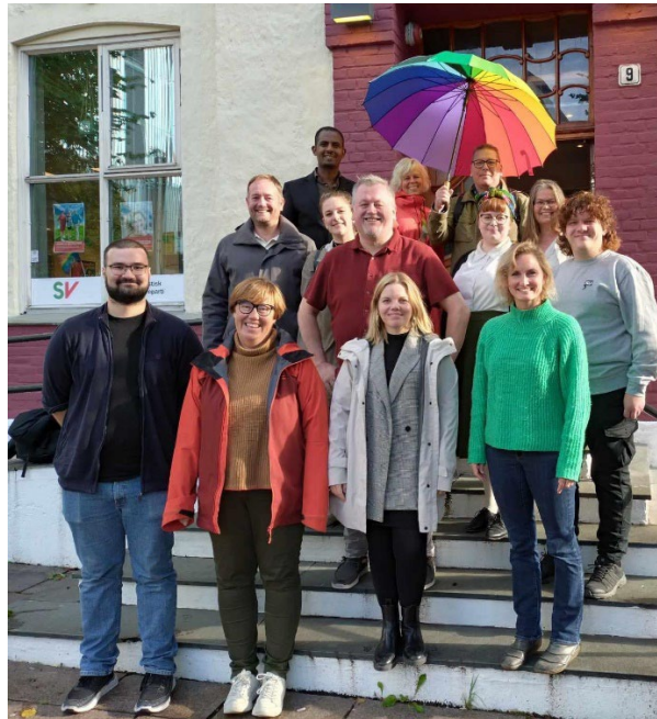
Figur 2: Fylkesstyret og tilsette